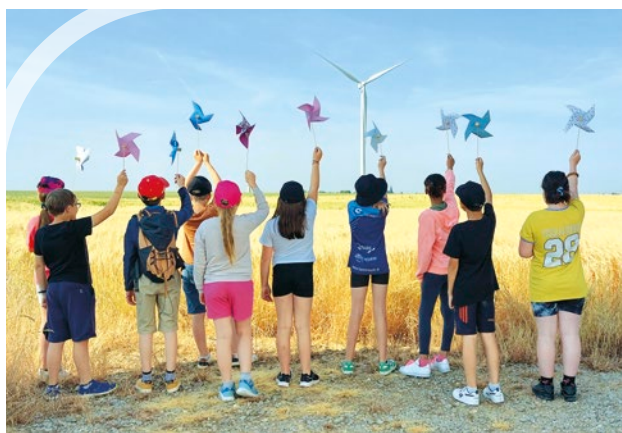
Lors de l'inauguration du parc éolien de la Butte de Menonville à Villars (28)

Et c'est plus de 100 collégiens du collège Marais Poitevin de Benet qui sont arrivés à vélo sur le parc éolien de Benet. Tous ces élèves ont pu visiter le pied d'une éolienne et participer à différents ateliers de sensibilisation. De nombreux échanges interactifs ont ponctué cette journée.