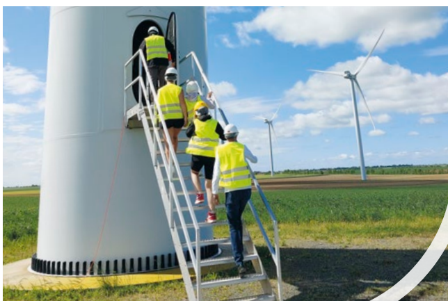
Élèves de 2 de du Lycée agricole de Châteaudun, visite chantier de construction du parc éolien de Bois élie dans la Beauce, (10 éoliennes d'une puissance totale de 22MW)

Les étudiants étaient curieux d'en savoir plus sur le système de vente de l'électricité, les contraintes et potentiels de développement éolien sur notre territoire, les prix de l'électricité. Une excellente façon de découvrir concrètement le rôle indispensable de l'éolien dans le mix énergétique et son impact positif sur notre économie.