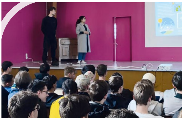
Opération Génération Transition Ces journées nationales ont rassemblé 8000 jeunes au pied de 140 parcs.

Les élèves ont pu visiter le pied d'une éolienne et ont été sensibilisés à l'intérêt de développer des énergies renouvelables en territoire rural.