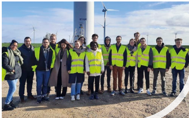
Étudiants en Master 2 économie de l'énergie, Université Paris Saclay Visite du parc éolien de Grande Pièce en Eure-et-Loir

En ce début d'année 2023, Volkswind a accueilli des élèves de tout horizon entre 7 et 25 ans. L'occasion entre autres de les sensibiliser à la nécessité de la transition énergétique.